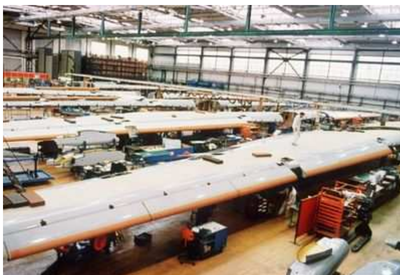
(Fabryka Airbusa w Bremie / 1993)

Zdaniem prezes PTE, połączenie RFN i NRD było bardzo kosztownym zabiegiem. Wciąż podzielone są zdania, czy został on prawidłowo przeprowadzony. Jednak w dłuższej perspektywie z pewnością się opłacił. Niemcy Zachodnie dostały nowy potencjał do rozwoju, nowych ludzi, nowy obszar działalności gospodarczej.