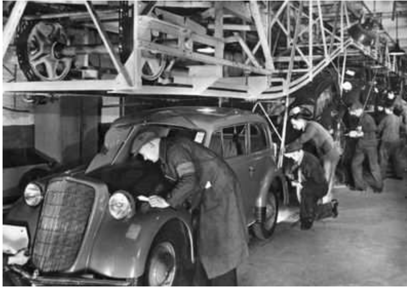
(Fabryka Opla z 1937 roku)