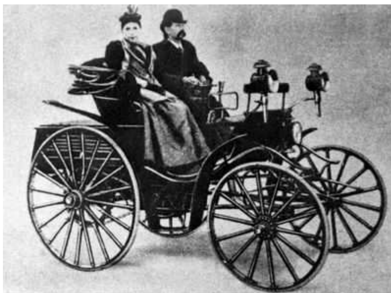
(Carl Benz na samochodzie swojej produkcji / XIX w.)

Pod koniec XIX wieku Niemcy były wiodącym producentem węgla i stali. Do najważniejszych ośrodków przemysłowych należały Ruhry oraz Śląsk.