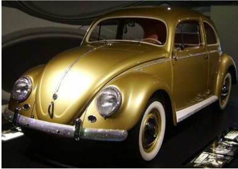
(Volkswagen Beetle - jeden z najpopularniejszych samochodów w historii)

Zaznacza, iż każdy kraj ma swój własny instytut badania sytuacji gospodarczej w świecie i w kraju. W rezultacie rząd ma co roku do dyspozycji kilkanaście raportów o stanie gospodarki Niemiec i świata. Często są to raporty o skrajnie sprzecznych wnioskach, a oceny są niejednorodne. Ale właśnie dzięki temu władze mają szersze spojrzenie na procesy i trendy zachodzące zarówno w kraju, jak i za jego granicami. Wykrywają długofalowe trendy i możliwe zagrożenia. Tak było wtedy i tak jest do dzisiaj.