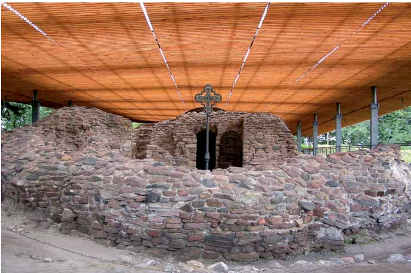
Palatium na Ostrowie Lednickim