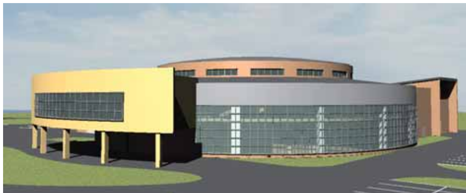
Wizualizacja Centrum Wykładowo-Dydaktycznego w Koninie.

3 listopada podpisano pre-umowę na realizację zadania Rewaloryzacja Wzgórza Lecha w Gnieźnie . Koszt projektu to 3 870 000 euro , a poziom dofinansowania z UE wynosi 70%. Zadanie to będzie realizować w latach 2009-2012 Archidiecezja Gnieźnieńska.