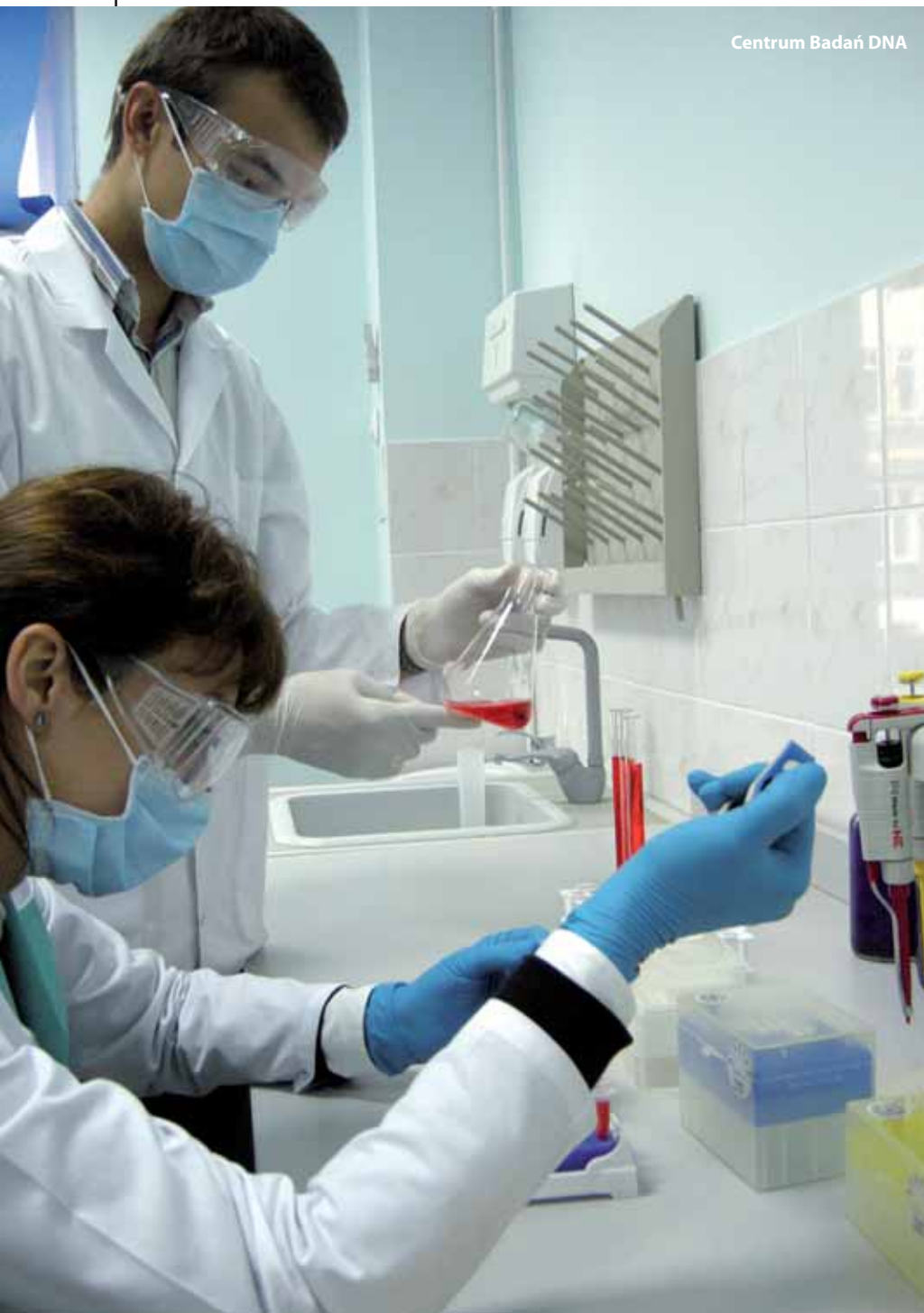
Centrum Badań DNA

Po co firmom regionalna strategia innowacji (RSI)? Niewielu przedsiębiorców przegląda takie dokumenty. Nie jest to lektura, bez której działalność firmy może być zagrożona. To raczej biblia dla tych, którzy mają wpływ na politykę regionalną.