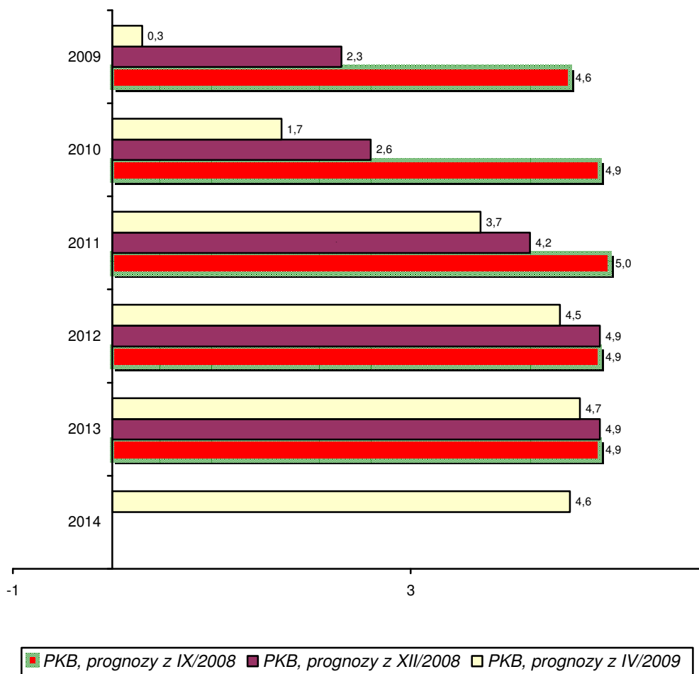
Wzrost PKB w latach 2009-2014 według średniej prognoz ekspertów RK z września 2008, grudnia 2008 r. i z kwietnia 2009 r.